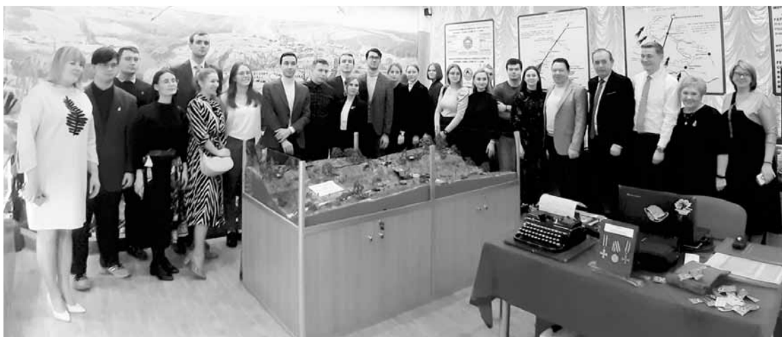
В музее подольских курсантов

В 2015 году, когда страна отмечала 70-летие Победы, на территории школы силами ребят, учителей, предприятий, жителей города был создан памятник подольским курсантам. К нему участники «Молодежной эстафеты» возложили цветы. Наверное, главный урок, который мы все получили на этой встрече, - урок памяти.