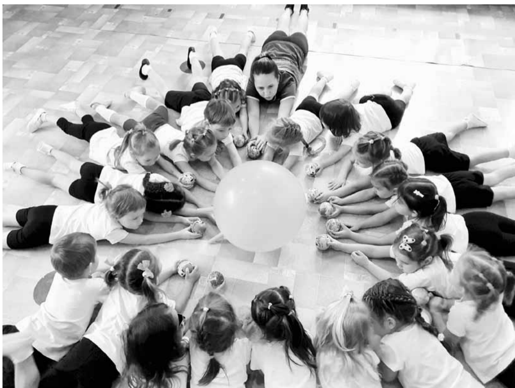
На занятиях в детском саду скучно не бывает

Иркутская областная организация Общероссийского Профсоюза образования